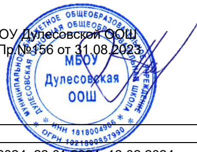
График проведения оценочных процедур в 1 - 4 классах МБОУ Дулесовской ООШ на 2023-2024 учебный год